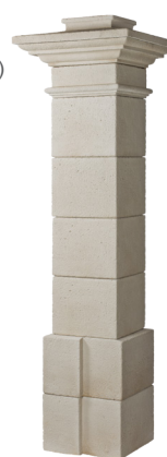
PILIER VALANCAY Monumental H. 222.5 x L.42 cm (pilier fini)