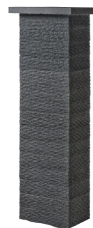
PILIER CISELE Chapeau débordant H. 155 x L.42/30 cm (pilier fini) (hauteur pilier fini pour 15 boisseaux)