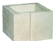
Embase droite et gauche VALANCAY MONUM. l. 42 x h. 30 cm