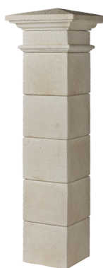
PILIER VALANCAY H. 182 x L.35 cm (pilier fini) (hauteur pilier fini pour 5 boisseaux)