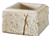
Boisseaux BRIDOIRE l. 35 x h. 20 cm