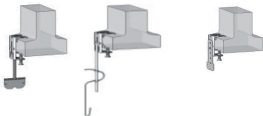
Suspenstes toutes largeurs et toutes longueurs.

Compatible avec toutes longueurs et largeurs de suspenstes