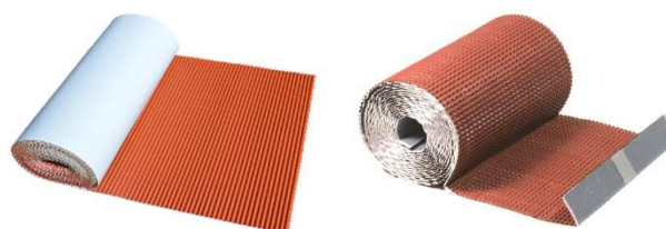
L1 : Plissage 1 sens