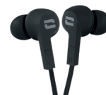
ÉCOUTEURS ÉTANCHES IPX6