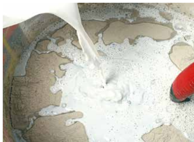
En adjuvantation de l'eau de gâchage

Ce document technique peut faire l'objet de mise à jour, il est de la responsabilité de l'utilisateur de contrôler systématiquement si une version plus récente est disponible sur notre site www.cermix.com . Il est de la responsabilité de l'applicateur de contrôler la compatibilité et l'adéquation des produits pour la réalisation des travaux. Des essais peuvent être réalisés au préalable pour valider le bon comportement des produits.