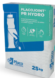
Enduit en poudre (10 kg ou 25 kg)