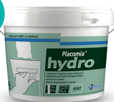
Enduit prêt à l'emploi (15 kg)