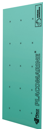
Plaques de plâtre, cloisons ou complexes isolants hydrofugés*

Les SOLUTIONS PLACO® pour les LOCAUX HUMIDES PRIVATIFS (EB+p)