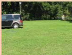
Après installation, la pelouse pousse rapidement à travers le GrassProtecta