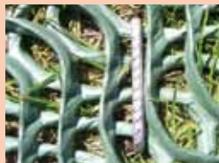
Fixée par des fiches