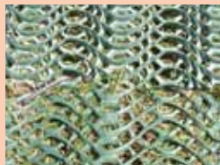
2 nappes jointes ensemble par des fiches