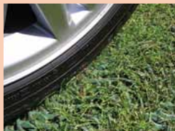
Nappe après installation