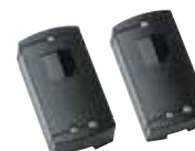
Cellules photoélectriques EL 301