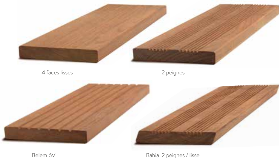
4 faces lisses