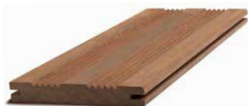
2 peignes / lisse (clip hardwood)