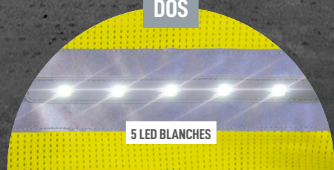
5 LED BLANCHES