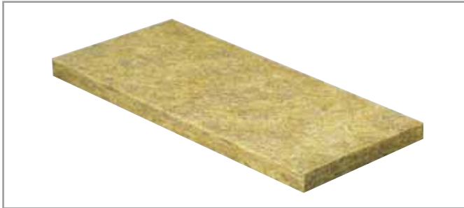
ROCKFEU REI 60 RsD