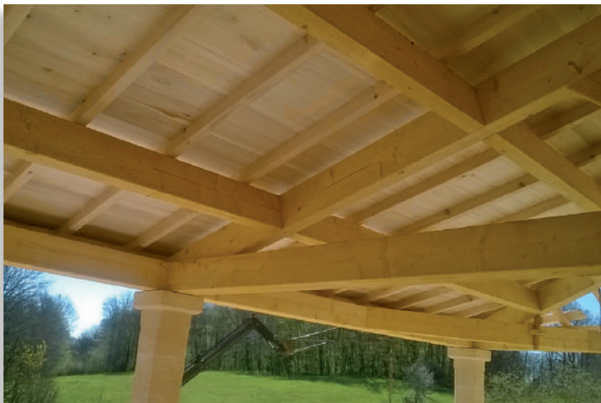
Charpente apparente en poutres contrecollées