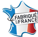
Caisse emboutie avec marquage "Made in France"