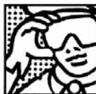
- Irritant mécanique pour la peau. - Porter un masque (type P1 utilisé pour les travaux courants) et des lunettes de protection en cas de fort empoussièrement. - Porter un vêtement de protection et des gants appropriés.