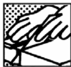
Couper au couteau sur une surface rigide. Ne pas utiliser de scie surtout mécanique.