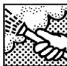
Déposer avec soin les matériaux isolants :si possible humidifier pour limiter l'envol de poussière.