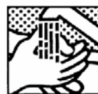
En fin de travail, dépoussiérer les vêtements et se laver à l'eau.