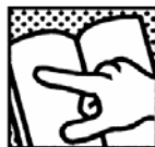
Lire les recommandations du fabricant

Ces précautions d'emploi sont résumées sous forme de textes et de pictogrammes sur les emballages des produits des industriels du FILMM :