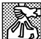
Tenir propre le lieu de travail.