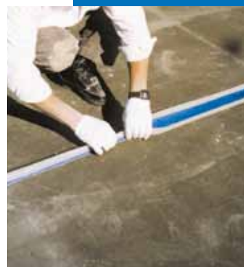
Exemple d'imperméabilisation d'un joint de dilatation sur une terrasse.