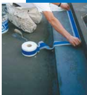
Imperméabilisation de la jonction entre le support et le bassin avec Mapeband.