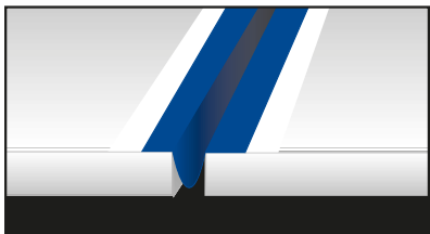
Traitement d'un joint de dilatation