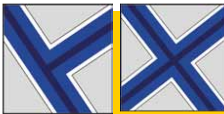
Positionnement de la pièce spéciale en T