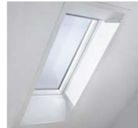
Habillage intérieur préfabriqué (réf. LSB)

Les Français sont attachés à leur intérieur. Par tout un ensemble de détails, une fenêtre de toit VELUX doit s'intégrer harmonieusement à la décoration de la pièce à la fois par son design, mais aussi par les habillages intérieurs.