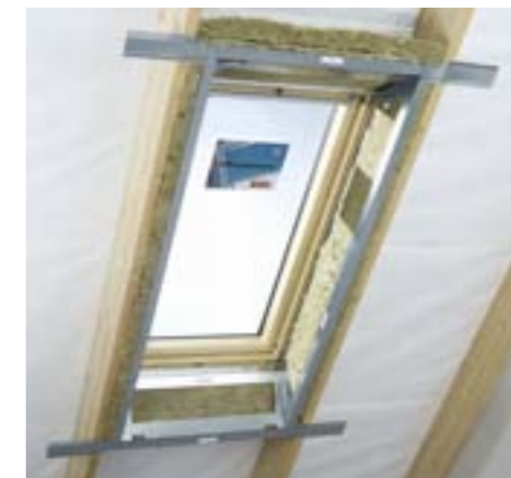
Cadre métallique pour habillage intérieur (réf. LSG)