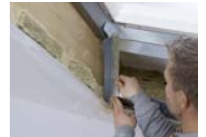
Mise en place et ajustement des différents supports métalliques.