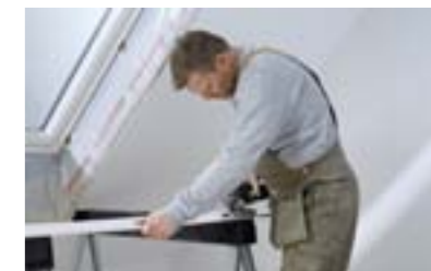
Découpe et adaptation de l'habillage.