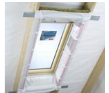
Installation de la colerette pare-vapeur BBX.