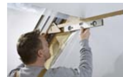
Définir le gabarit de coupe en fonction de la pente du toit.