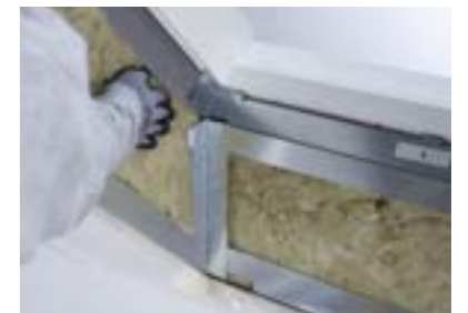
Mise en œuvre de l'isolation entre le rampant et le kit pour habillage intérieur LSG.