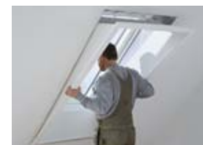
Mise en place de l'habillage sur l'encadrement.