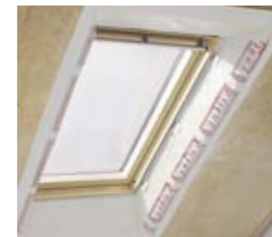
Installation de la colerette BBX.