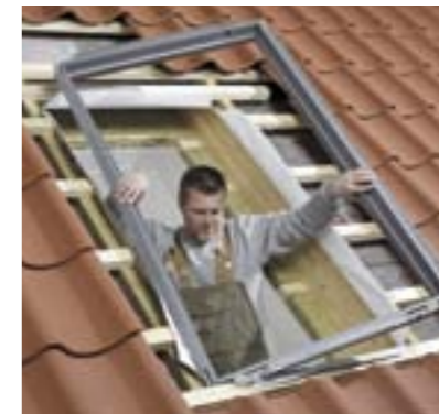
1 Bloc isolant (réf. BDX)

Pour les fenêtres de toit, l'efficacité énergétique passe par le choix d'une fenêtre hautement isolante (type Confort ou Tout Confort), une pose encadrée, et le traitement efficace des liaisons périphériques de la fenêtre avec son environnement.