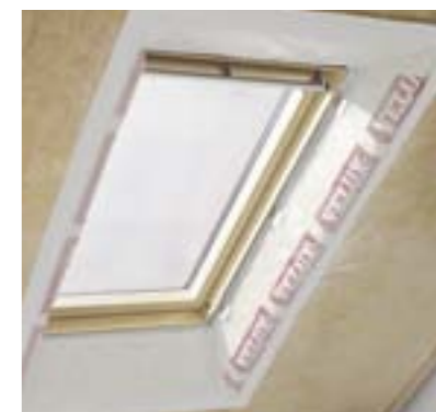
3 Colerette pare-vapeur (réf. BBX)