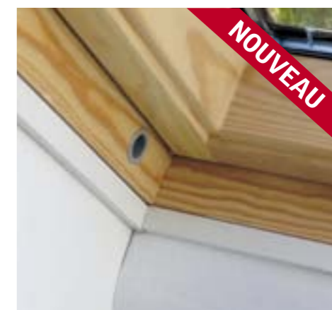
Profils de remplacement pour raccord EDN (réf. LGN)