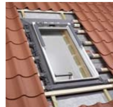
2 Colerette d'étanchéité pour écran de sous-toiture (réf. BFX)