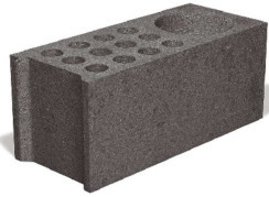
Bloc angle perforé