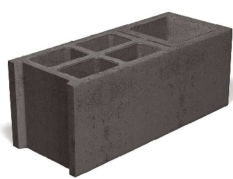
Bloc angle creux

Blocs de granulats courants pour la réalisation de chaînages horizontaux et de raidisseurs verticaux.