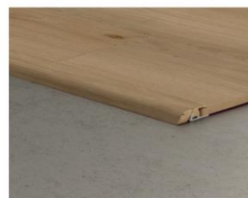
Profilé de transition 2150 x 48 x 13 mm Relier deux sols de hauteurs différentes.

4 applications en 1 seul produit SFINCP(-) 2150 x 48 x 13 mm