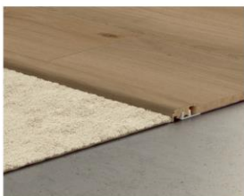
Profilé de transition moquette 2150 x 41 x 13 mm Créez une belle transition entre votre sol stratifié et d'autres types de revêtements de sol.