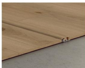
Profilé de fractionnement 2150 x 40 x 13 mm Connecter deux sols de même hauteur.