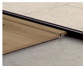
Profilé d'arrêt 2150 x 41 x 13 mm Finissez votre sol le long des murs ou fenêtres