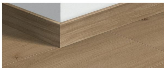
Plinthe standard SFSK(-) 2400 x 58 x 12 mm