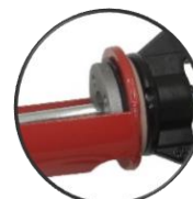
Renfort en métal