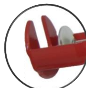
Soudage à fil continu