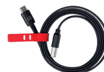
CABLE USB-A / USB-C