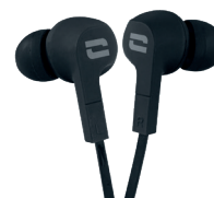
ÉCOUTEURS ÉTANCHES IPX6