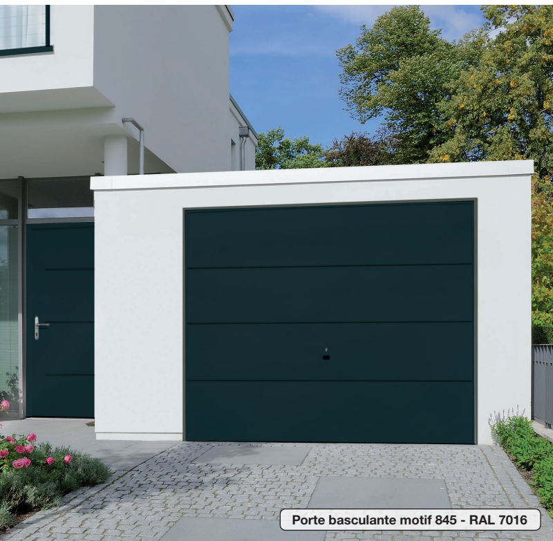
Porte basculante motif 845 - RAL 7016

Porte basculante avec cadre dormant en acier galvanisé, panneau à flans lisses horizontaux.