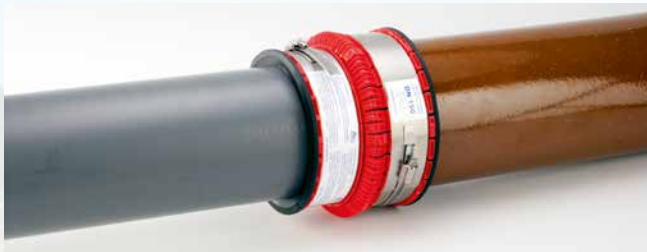
... un tuyau CR 8 PVC-U et un tuyau grès ...