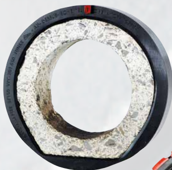
Tuyau en béton à fond plat avec adaptateur VPC 150 BF enfilé ...

Lors du montage, placer l'adaptateur 150 BF sur le tuyau en béton avec base aplatie de manière à ce qu'il se cale parfaitement contre le bord en béton. Enfiler ensuite le manchon VPC® et procéder au montage en suivant les instructions fournies dans le manuel de pose. Ensuite, positionner l'adaptateur VPC KB devant le tuyau en béton et procéder au raccordement en suivant le manuel de pose. Les deux composants font partie du kit livré.