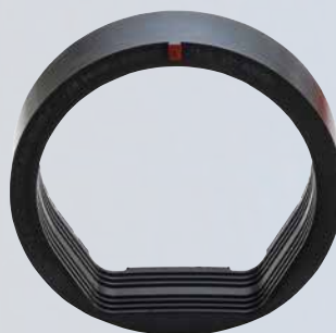
Adaptateur VPC 150 BF

La version VPC 150 BF du manchon VPC® Funke (pour les tuyaux en béton de diamètre extérieur de 210 à 215 mm) est également utilisable pour le raccordement d'un tuyau en béton à fond plat. Pour ce faire, l'adaptateur VPC KB et l'adaptateur VPC 150 BF sont nécessaires. Pour les autres diamètres nominaux, l'adaptateur BI Funke est disponible.