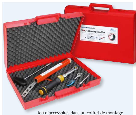
Jeu d'accessoires dans un coffret de montage