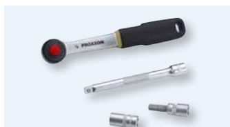
Kit cliquet réversible pour VPC 100 – 270