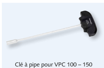
Clé à pipe pour VPC 100 – 150