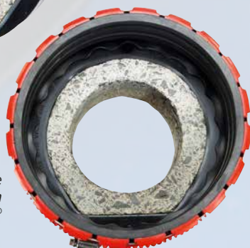
... et à l'étape suivante avec manchon d'adaptation VPC®