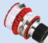
DN 100 à DN 200