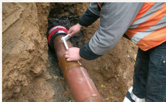
Réparation de conduites défectueuses