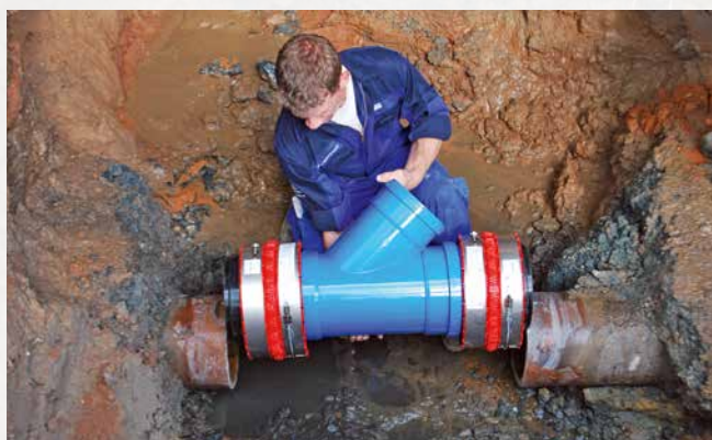
Ajout après coup d'un branchement dans une conduite en grès déjà posée