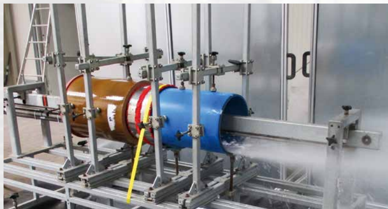
Test de rinçage haute pression selon la norme DIN 19523 dans les locaux de la société iro GmbH, à Oldenburg

Pour le raccordement de tuyaux en grès, la norme DIN EN 295 s'applique également. Une force de cisaillement correspondant à 25 fois le diamètre nominal en newtons – pour un diamètre nominal de DN 200, il s'agit donc de 25 \times 200 = 5000 \text{ N} = 5 \text{ kN} = 500 \text{ kg} – est alors appliquée à la pièce. De même : pour les diamètres nominaux allant jusqu'à DN 200, l'angulation passe de 5 à 8 %.