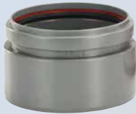
Adaptateur pour solution spéciale DN 150