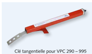
Clé tangentielle pour VPC 290 – 995