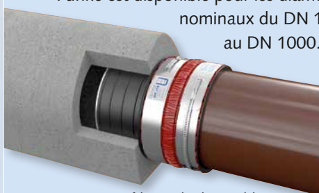
Jonction pour profil ovoïde disponible sur demande

En cas de transition de tuyaux à géométrie extérieure non circulaire, l'adaptateur BI Funke est disponible pour les diamètres nominaux du DN 100 au DN 1000.