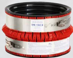
Manchon d'adaptation VPC®

Pour le raccordement de tuyaux en matière plastique avec des tuyaux en béton ronds de diamètres nominaux DN 250 à 800, il existe un adaptateur qui compense la grande différence d'épaisseur de paroi qu'il y a toujours, compte tenu des caractéristiques des matériaux en question. Pour le raccordement de tuyaux en matière plastique avec des tuyaux en béton ronds de diamètre nominal DN 150, il existe une solution spéciale sous la forme d'un petit adaptateur. Les adaptateurs et manchettes pour les plages de DN 250 à DN 800 sont disponibles séparément. Les composants nécessaires à la transition à un tuyau circulaire en béton DN 150 sont disponibles en kit complet (numéro d'article VPC 150 B).