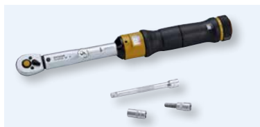
Clé dynamométrique pour VPC 100 – 2400