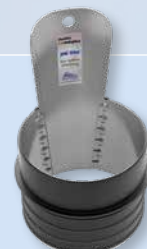
DN 150 à DN 1000