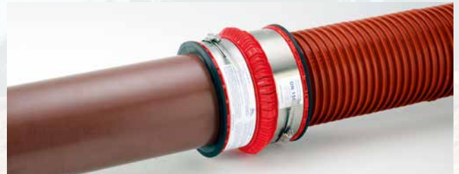
... un tuyau CR 12 (HSK) PVC-U et un tuyau à ailettes.