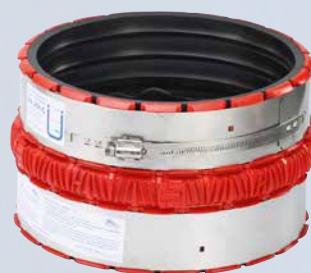
Manchon d'adaptation VPC®