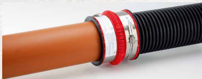
... tuyau CR 4 PVC-U et un tuyau annelé ...