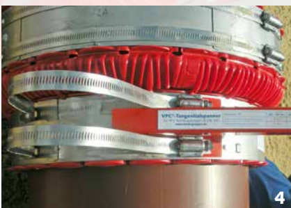
Adaptation exacte au diamètre