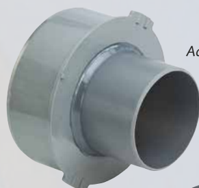
Adaptateur VPC KB