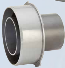
Adaptateur VPC KB pour raccordement matière plastique (PE, PP, PVC) au tuyau béton rond DN 250 – DN 800