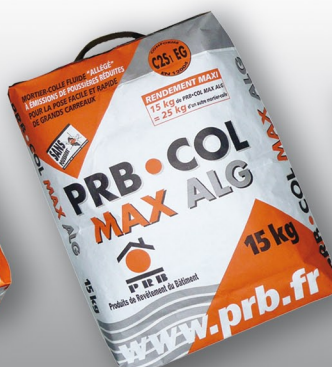
PRB COL MAX ALG Mortier colle fluide allégé à émissions de poussières réduites pour la pose facile et rapide de grands carreaux. CLASSE C2S1 EG