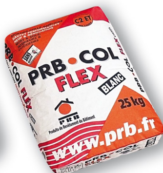
PRB COL FLEX Mortier colle amélioré hautes performances Travaux neufs et rénovation. CLASSE C2 ET