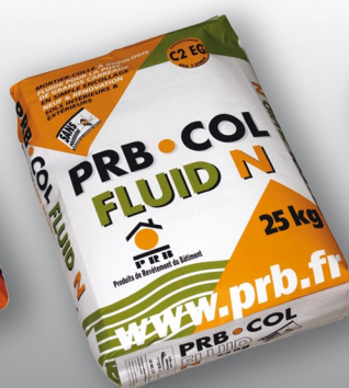
PRB COL FLUID N Mortier colle à rhéologie fluide pour la pose de grands carreaux en simple encollage. CLASSE C2 EG