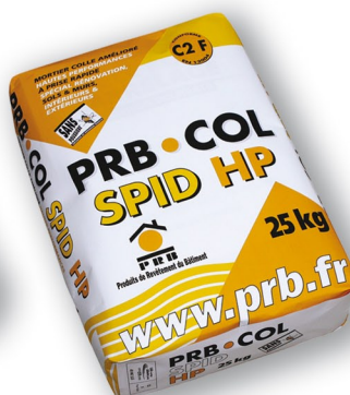
PRB COL SPID HP Mortier colle amélioré hautes performances à prise rapide spécial rénovation. CLASSE C2 F