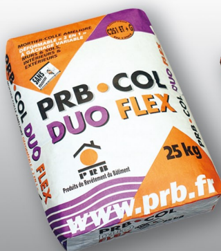
PRB COL DUO FLEX Mortier colle amélioré déformable "2 en 1" à gâchage variable pour la pose facile des carrelages. CLASSE C2S1 ET (normale) CLASSE C2S1 EG (fluide)