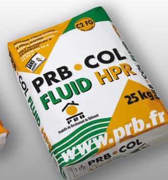
PRB COL FLUID HPR Mortier colle fluide hautes performances à prise rapide. CLASSE C2 FG

Colle à carrelage Adhesive for tiles CERTIFIÉ CSTB CERTIFIED