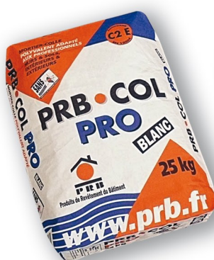
PRB COL PRO Mortier colle polyvalent adapté aux professionnels. CLASSE C2 E