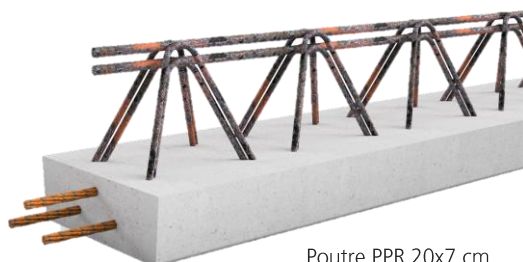
Poutre PPR 20x7 cm

NF 394 : Éléments de structure linéaires en béton armé et précontraint