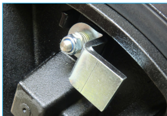
10 Verrouiller le produit avec la clé OTCN