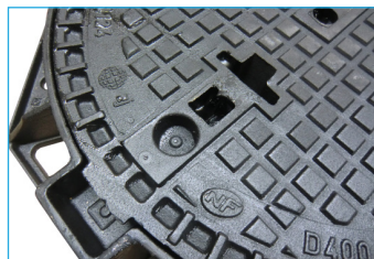
1 Dispositif SOLO RETROFIT avec pastille