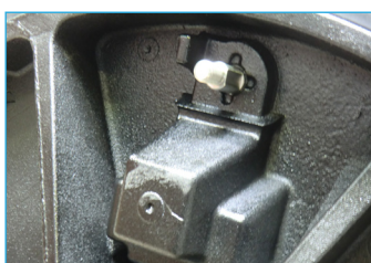
6 Mettre en place l'axe de verrouillage en surface