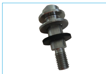
5 Assembler l'axe de verrouillage, la rondelle en caoutchouc et la rondelle Ø 16