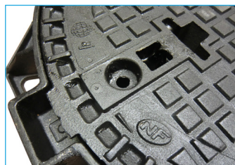
3 Tampon prêt à être équipé du kit de verrouillage