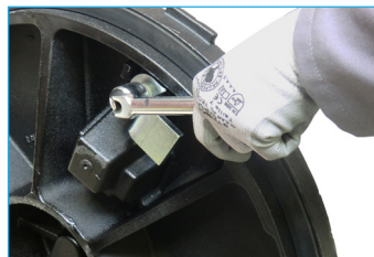
9 Serrer l'ensemble avec clé de 19 et clé de verrouillage OTCN