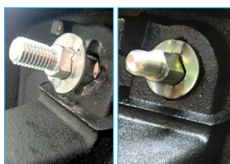
7 Ajouter la rondelle ergot en sous-face