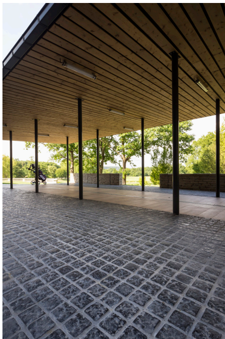
Pavés coloris Noir ardoise