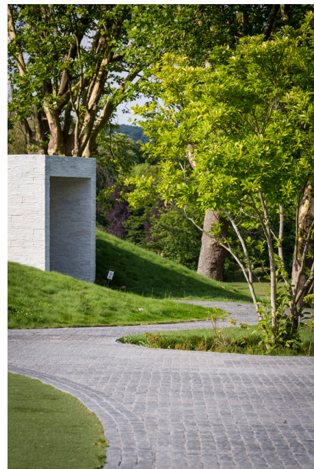
Pavés coloris Cobaltium