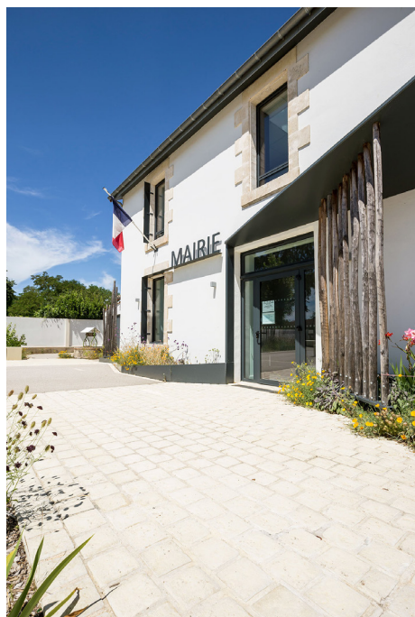
Pavés coloris Calcaire Vieilli