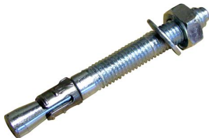
Goujon fileté FT