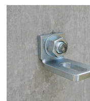
Goujon fileté FT - vue en situation