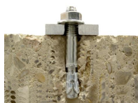
Goujon fileté FT - vue en coupe

ETE 08-0327 option 7 pour béton non fissuré