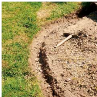
1 Préparez le fond de forme