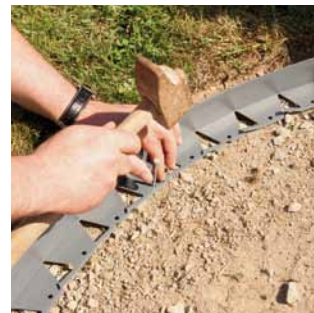
3 Posez le Tcourb'