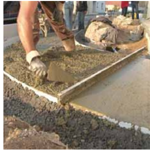
Tcourb' autorise toutes les libertés de formes pour petits ou grands chantiers. Un résultat esthétique garanti.