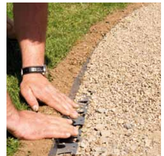
4 Appliquez les matériaux choisis