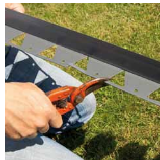
2 Sectionnez les réservations