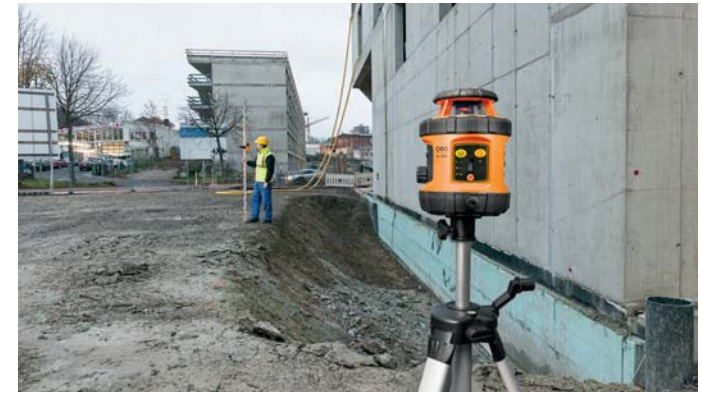
PACK FL 190A + FR 45 + BT + TN 14