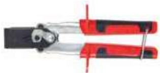
HM - l'outil de pose professionnel