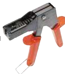
PA - Pince pour cheville HM