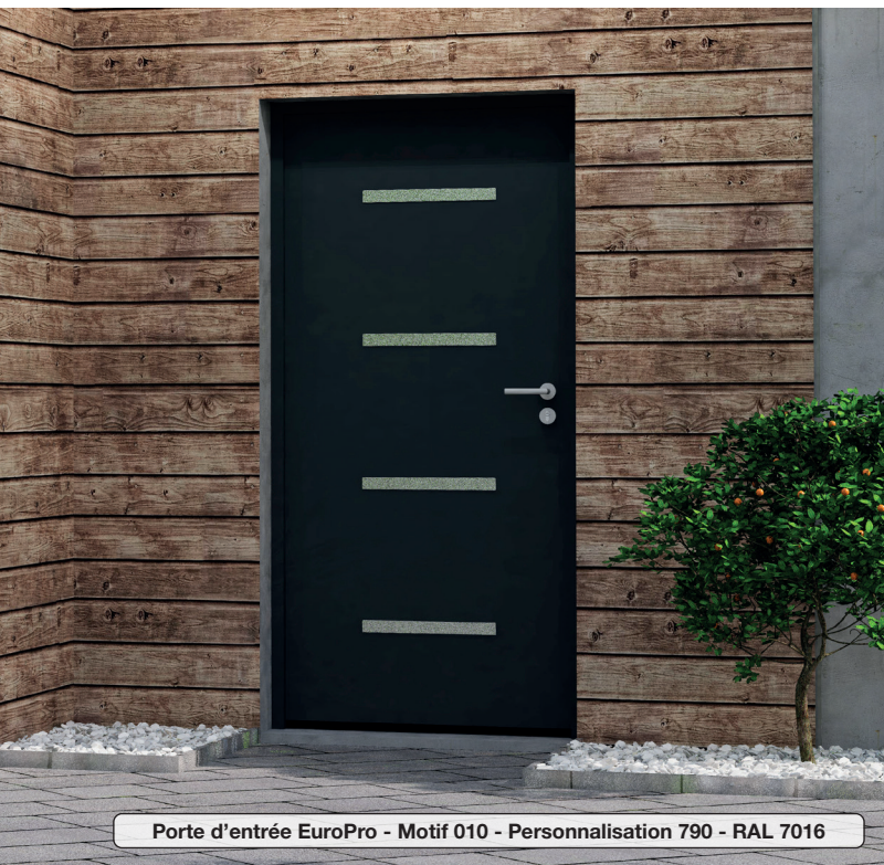
Porte d'entrée EuroPro - Motif 010 - Personnalisation 790 - RAL 7016