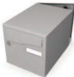
2 portes (285 x 285 x 400 mm)