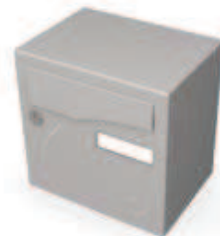
1 porte compact (voir p 89) (285 x 285 x 150 mm)