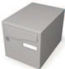
1 porte (285 x 285 x 385 mm)