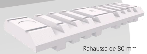
Rehausse de 80 mm