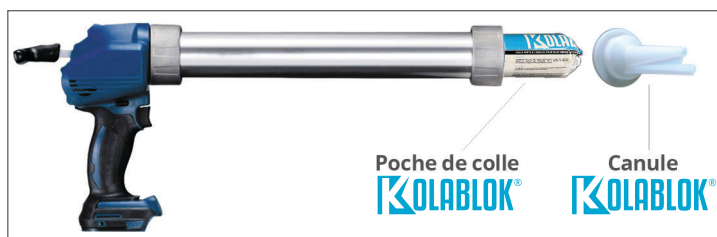
Poche de colle KOLABLOK®