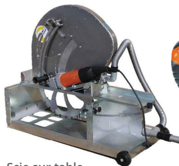
Scie sur table

Pour la réalisation des coupes, il est conseillé d'utiliser une scie sur table ou une disqueuse. Pour les blocs en béton de granulats légers, une scie alligator peut convenir.