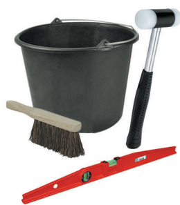
Seau, balayette, niveau, maillet caoutchouc

La colle polymère KOLABLOK® doit être stockée dans le respect des conditions ci-dessous :