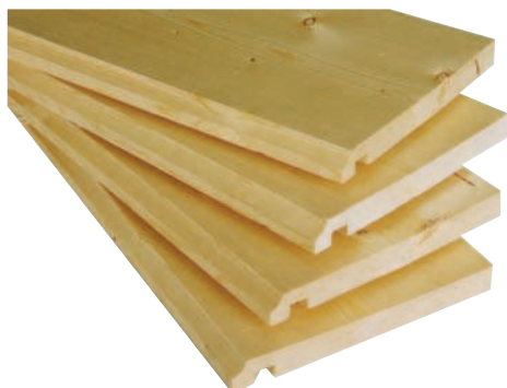
PLANCHE DE RIVE