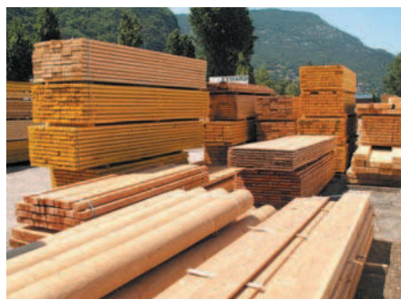
PLANCHE PLATEAU SAPIN TRAITE CLASSE 2