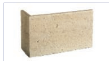
Chaîne d'angle L ± 50 x l ± 20 h ± 30. L ± 55 x l ± 25 h ± 30. L ± 60 x l ± 30 h ± 30. Épaisseur ± 2 cm.