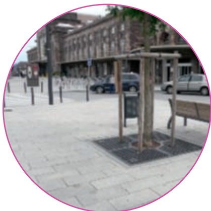
Mulhouse - Place de la Gare

À ce titre, le plan d'assurance qualité adopté par SANXIANGDA pour Cominex répond aux exigences de la réglementation et particulièrement au marquage CE.