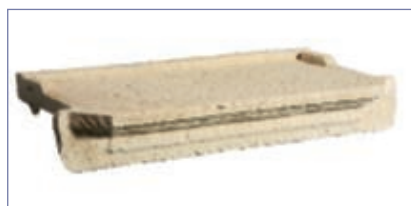
Appui de fenêtre L ± 100/120 x P ± 35

Le parement BRÉCY est composé de pierre de différentes longueurs (entre 50 et 60 cm) pour éviter l'alignement des joints d'une rangée sur l'autre. La hauteur des pierres est identique quelle que soit la longueur. Les angles de BRÉCY sont également conçus sur ce même principe de longueurs variables.