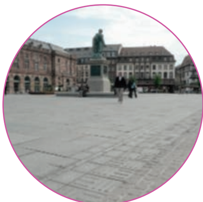
Strasbourg - Place Kleber

Filiale du Groupe VM Matériaux fort d'un demi-siècle de négoce, Cominex importe et commercialise du granit chinois. Ces pierres sont fournies par Sanxiangda, société faisant également partie du groupe VM et dont l'expérience et les compétences sont reconnues depuis bientôt vingt ans.