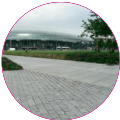
Strasbourg - Place de la Gare